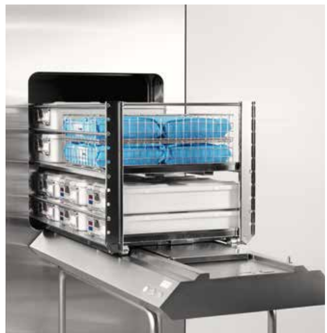
Chargeur et déchargeur automatique pour les supports à étagères/embases (GL64SR).