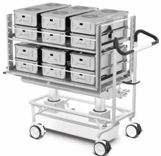
Chariots de chargement/déchargement Smart AHT.

La solution de chargement à point unique innovante et automatique de Getinge améliore le rendement des unités centrales de stérilisation dotées de plusieurs stérilisateurs. Dès qu'un stérilisateur est disponible, une nouvelle charge est lancée automatiquement, ce qui permet une disponibilité optimale et une utilisation complète des ressources.